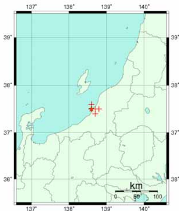
図：推定した震源の位置