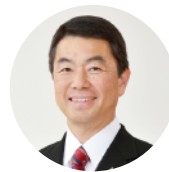
村井 嘉浩 宮城県知事 (web 会談)