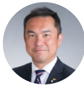
鈴木 英敬 三重県知事