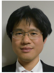
岩村 公太 内閣府政策統括官(防災担当)付参事官(調査・企画担当)付参事官補佐