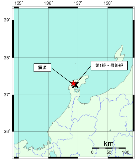
図: 推定した震源の位置