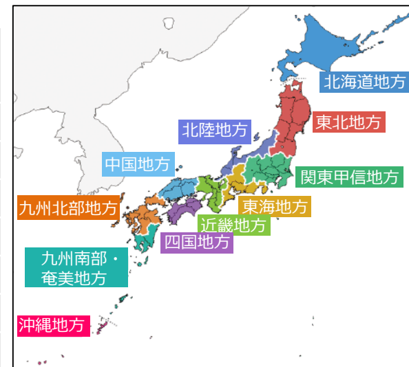
地方予報区（全国を11ブロックに分けた地域）