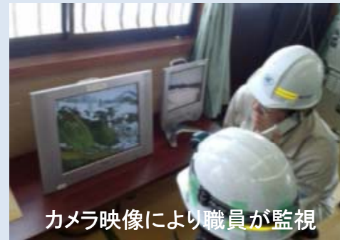
カメラ映像により職員が監視