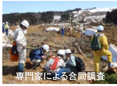
専門家による合同調査