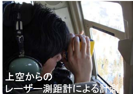
上空からの レーザー測距計による計測