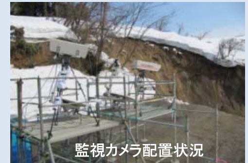
監視カメラ配置状況