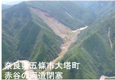
奈良県五條市大塔町 赤谷の河道閉塞