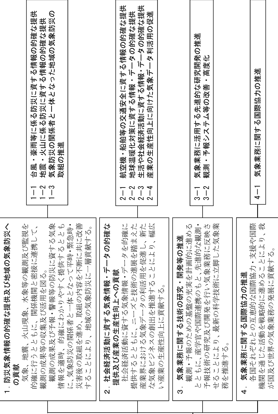
図1 気象庁の使命・ビジョン、基本目標