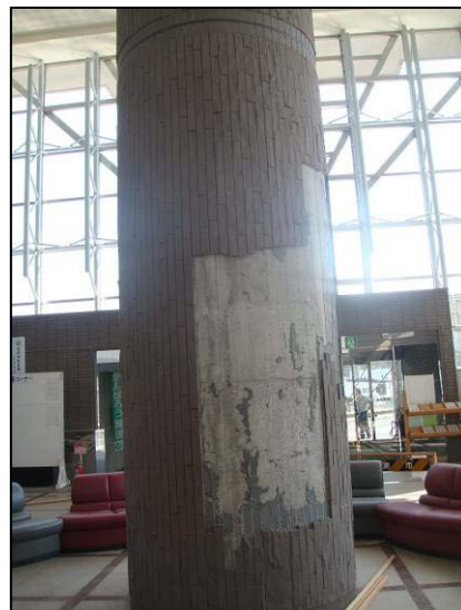
写真 12 栗原市役所の柱タイルの剥離