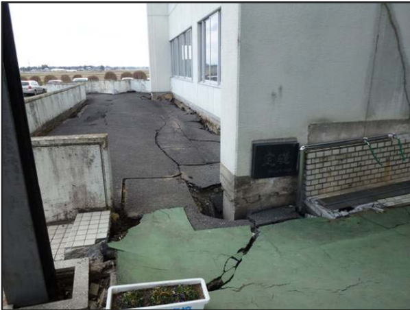
写真 9 栗原市若柳総合支所 玄関北側のアスファルトの破損