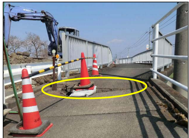
写真 22 那珂市瓜連 静跨線橋の段差