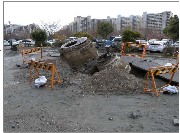
写真 28 浦安市高須 液状化によるマンホールの被害