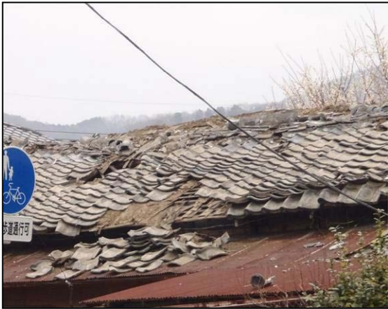
写真 30 群馬県桐生市元宿町 住家の屋根瓦損壊