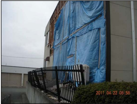
写真1 一関市花泉町 建物壁の落下