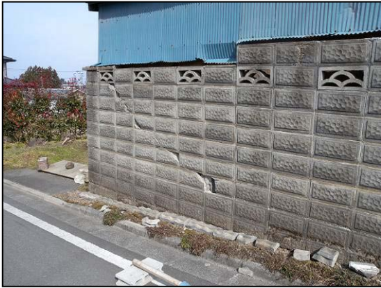
写真 13 栗原文化会館前の民家 ブロック塀の破損