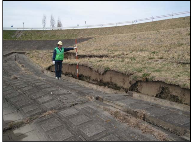
写真 26 香取市佐原二 堤の亀裂