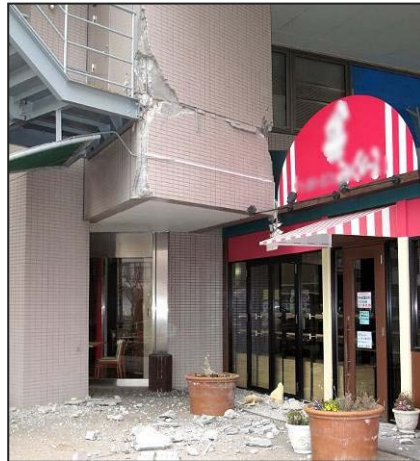
写真4 仙台市宮城野区 JR 仙石線榴ヶ岡駅付近のビルの損傷