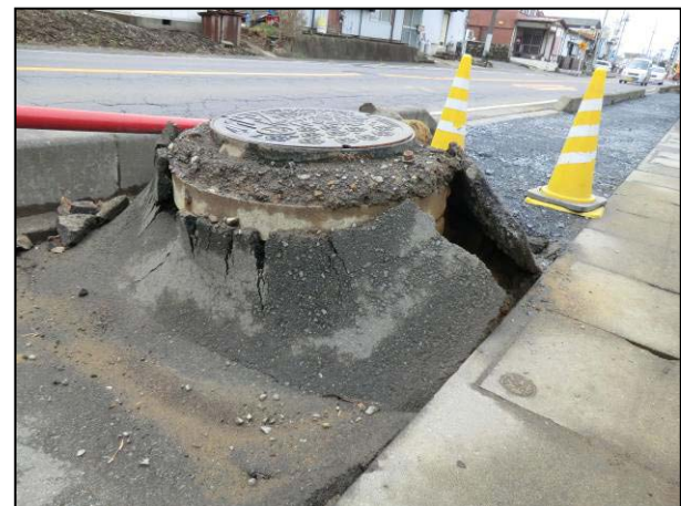
写真 24 茨城町小堤 歩道が陥没しマンホールが浮上