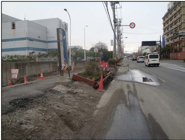
写真 27 浦安市舞浜 液状化による歩道被害