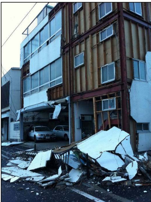
写真 17 福島市霞町付近 ビル外壁の破損・落下