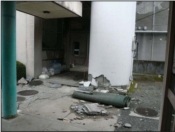
写真 19 須賀川市役所 庁舎北側のダストシュート周辺の破損