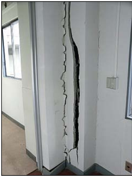
写真 32 大田原市 市役所庁舎の柱破損