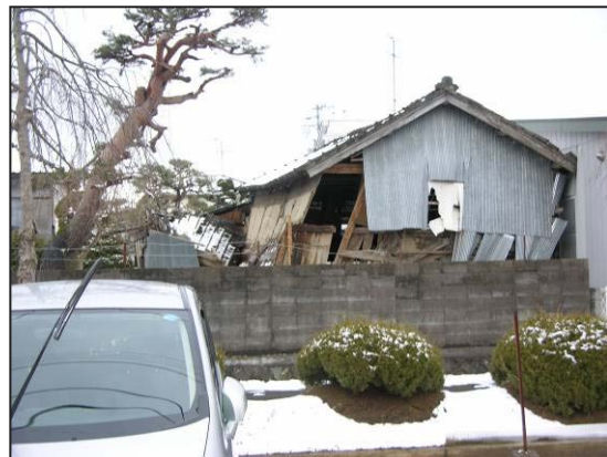
写真 16 涌谷町 涌谷町役場西庁舎近くの木造建築物損壊