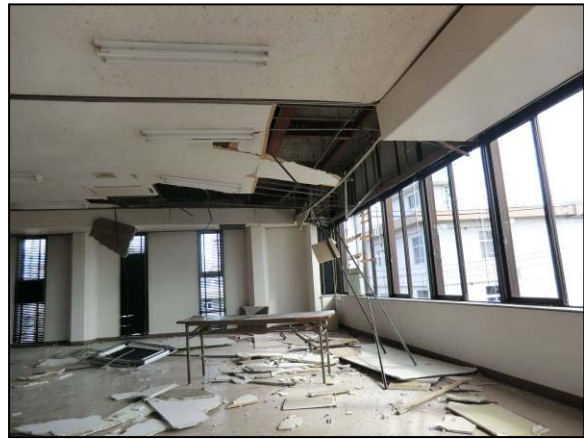
写真 33 真岡市 芳賀地区広域行政センターの被害 壁の破損（上）、天井の破損（下）