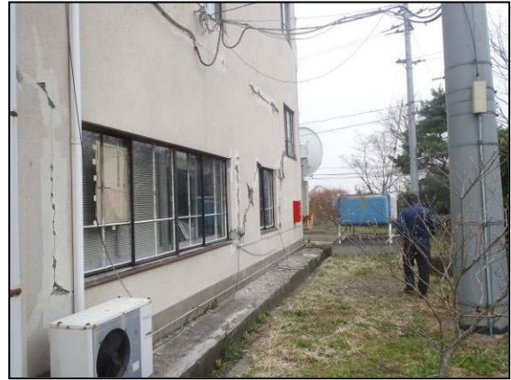
写真2 奥州市衣川区 奥州市衣川総合支所庁舎の外壁の損傷