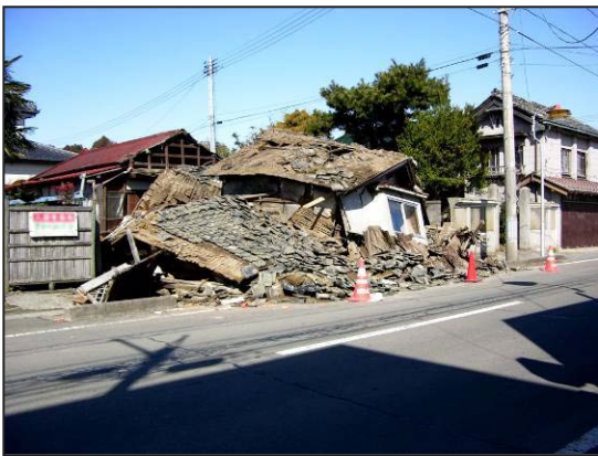
写真 15 松島町 木造納屋の倒壊