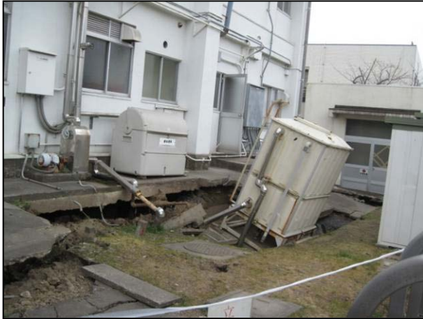
写真 25 香取市佐原口 地盤沈下による水槽の傾き