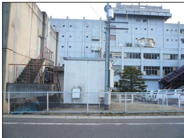
写真 18 郡山市朝日 1 丁目付近 市役所のクーリングタワーの破損