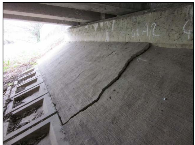
写真 29 亀裂南埼玉郡宮代町百間 橋梁接続部の道路陥没及び亀裂