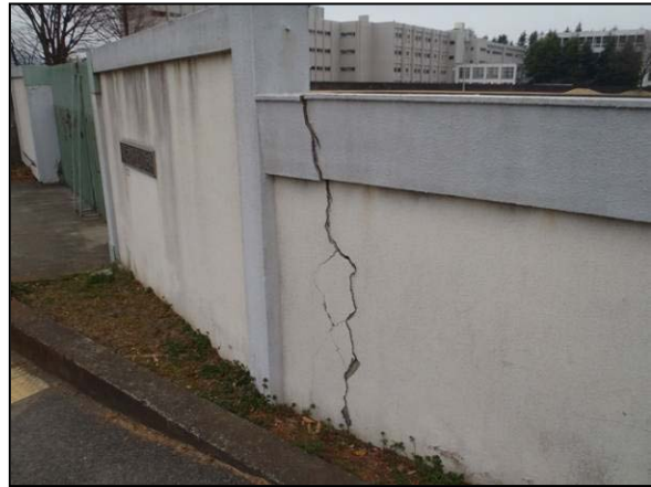
写真 31 群馬県桐生市元宿町 桐生市陸上競技場囲障の亀裂