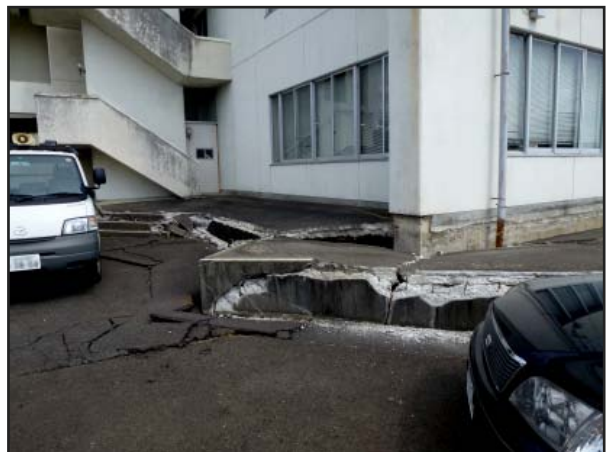
写真 10 栗原市若柳総合支所 庁舎周辺の犬走りの損壊