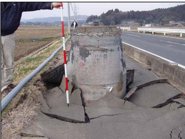
写真 21 常陸太田市玉造町 玉造十字路付近マンホールが浮上