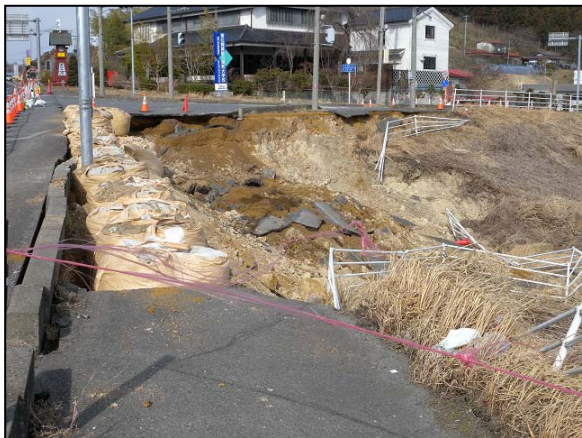
写真 11 栗原市築館国道 4 号線沿いの崖崩れ