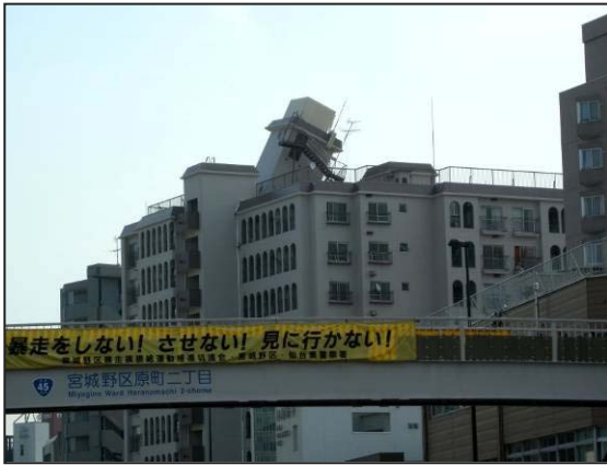
写真3 仙台市宮城野区 ビル上部の傾いた構造物