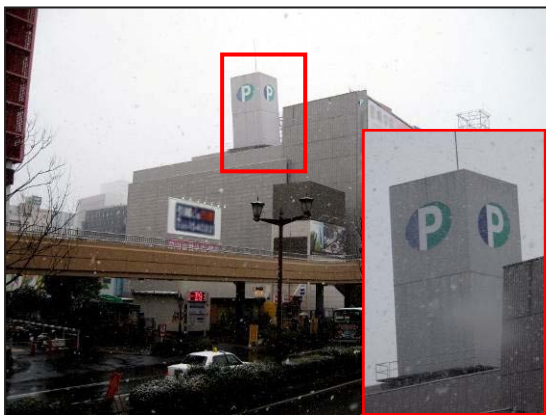
写真5 仙台市青葉区 仙台駅西口のパーキング屋上の傾いた構造物