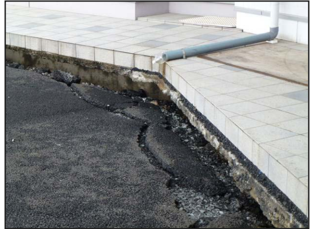
写真 8 石巻市桃生総合支所 庁舎周辺の犬走りと駐車場の境が損壊