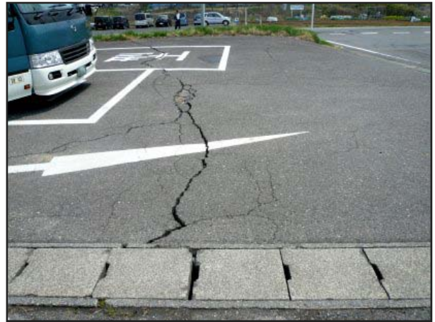
写真 20 須賀川市八幡山 震度計周辺 駐車場内のアスファルトの亀裂