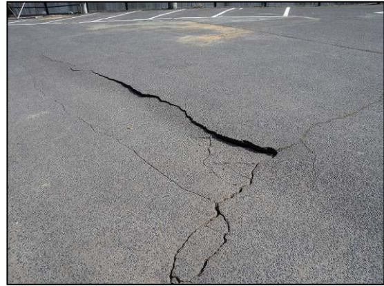
写真 14 栗原市役所近くの駐車場 アスファルト路面の損壊