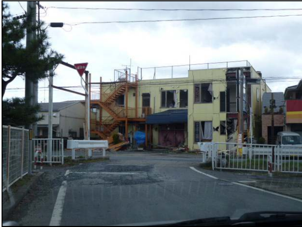
写真 7 中津山第二小学校付近 石巻市桃生町の震度計から北西約 50m の 建物窓ガラスや壁が損壊