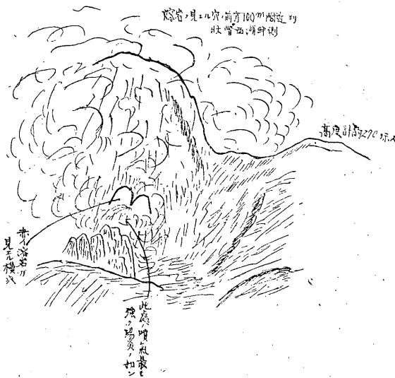
第 1 図

其の下部より噴出して居る水蒸気又は硫気は殆ど無色に近く丁度陽炎の如くゴウゴウと物凄いうなりを發して居た。之は正に地下の熔岩が次第に盛り上つて今やつと地表面に表れた所と思はれ大有珠の円頂丘と同じ生成のものではないかと思はれる。最早可なり温度も下り流れ出る様な心配は絶対にならない様に見えた。晝間の事とて判然とは分からないが火口の上部即ち洞穴の周囲も稍赤みを帯びてゐる即ち殆ど冷却しかつて居るが未だ稍赤熱して居る如くに見えた。歸りに壯瞥郵便局長に御話を伺つたら